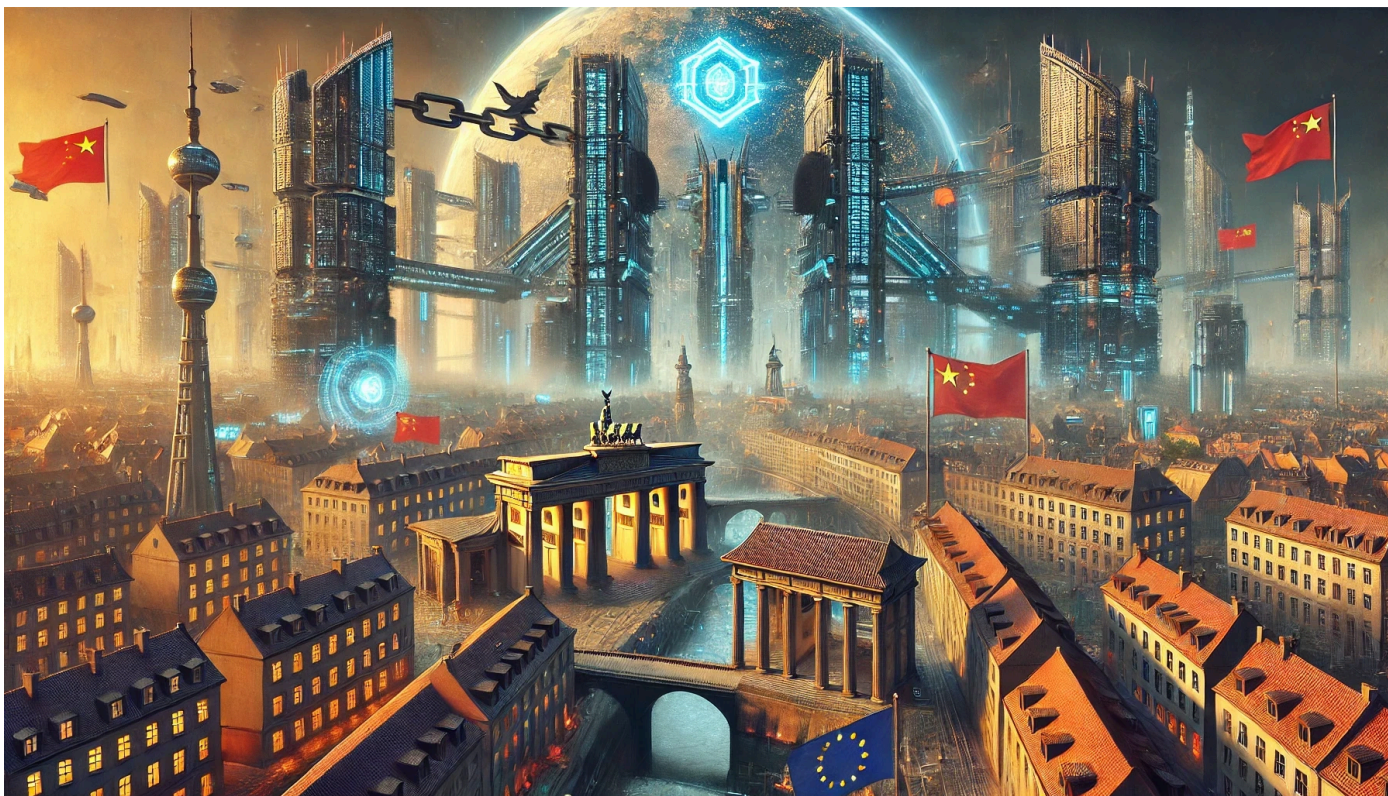
Ilustrace pesimistického scénáře Orwell