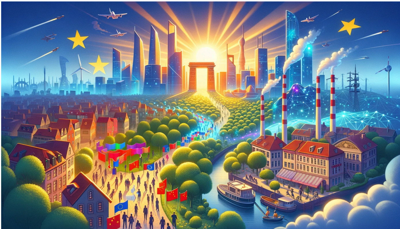
Ilustrace optimistického scénáře Světlo na konci tunelu