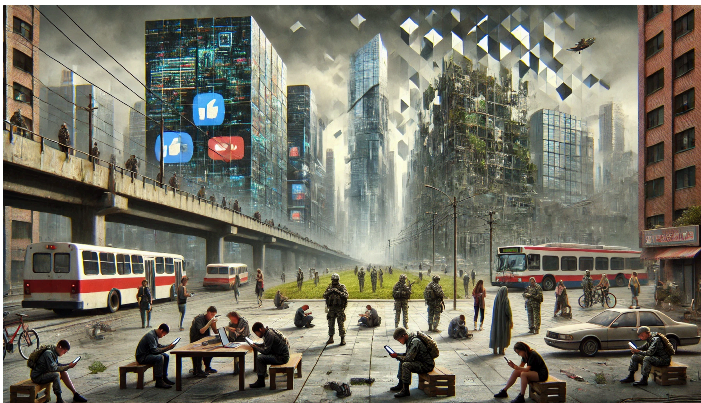
Ilustrace scénáře Informační závrat